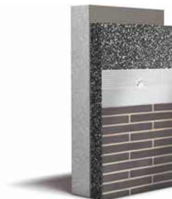
▲ Standaardopbouw gevelisolatiesysteem

Een woning met goede energieprestaties ligt beter in de markt. Zo levert een investering in thermische gevelisolatie nóg een keer voordeel op als u ooit beslist uw woning te verkopen of te verhuren.