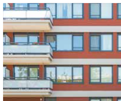
FACEBOARD PROFIELEN (DECORPROFIELEN)